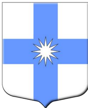
Схема теплоснабжения Муниципального образования Горское сельское поселение Тихвинского муниципального района Ленинградской области на период до 2030 года