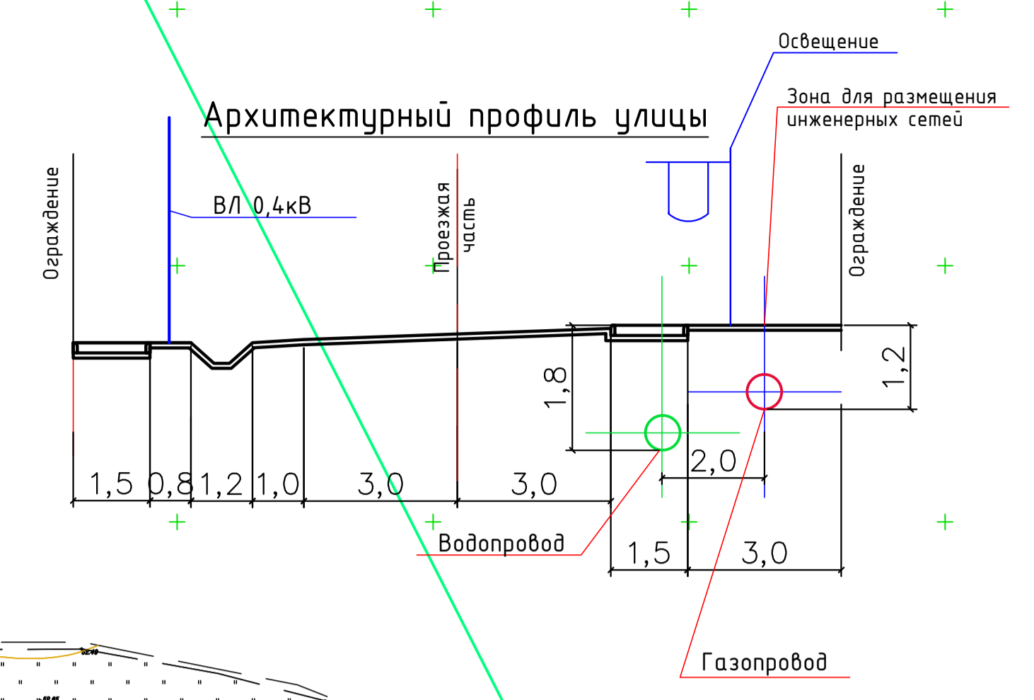
Схема инженерных сетей и сооружений