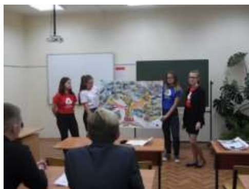
Медийное направление - семинар РДШ