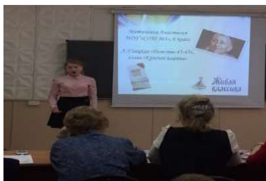
Муниципальный этап Всероссийского конкурса юных читателей «Живая классика-2018».