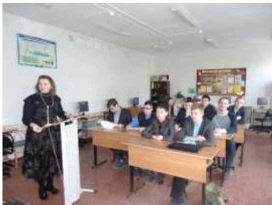
Участие представителей МОУ «Лицей.№7» в XXI международной научной конференции «Вишняковские чтения»