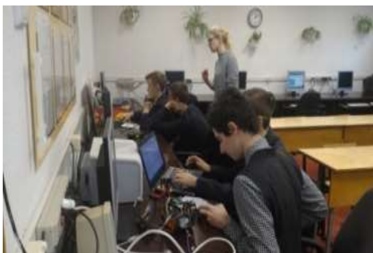
Знакомство с робототехникой