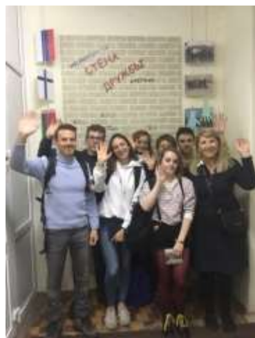
Личностное развитие – встреча друзей-французов