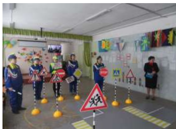
Образовательные проекты СОШ №6