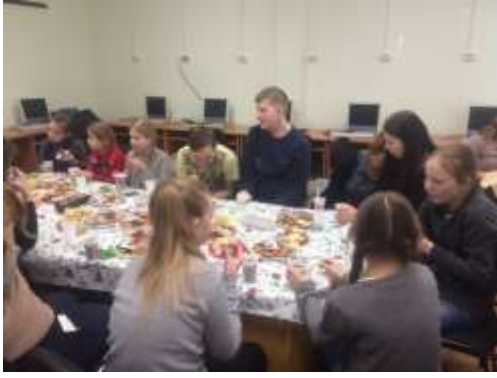
Женский день – 8 марта