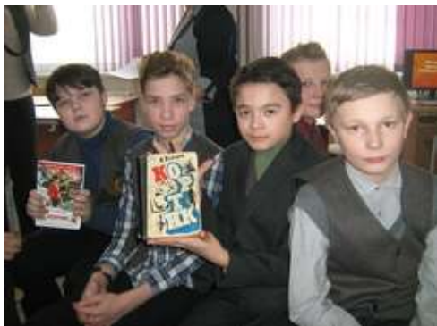
Участники интеллектуальной игры по повести А.Рыбакова «Кортик»