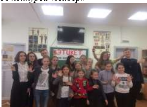
Этикет или хорошие привычки