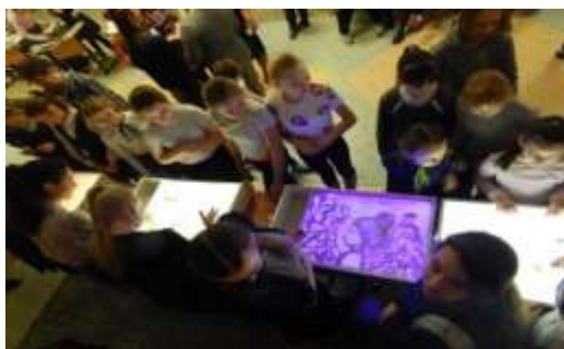
Неделя искусств в МОУ «Лицей.№8»