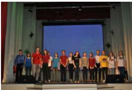
Творческая группа поддержки участников конкурса «Лидер»