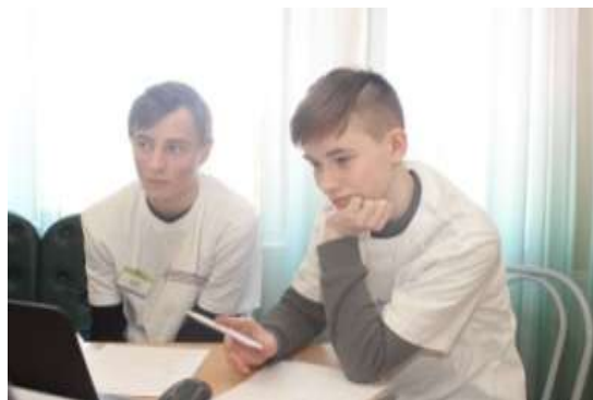
Финал Всероссийского конкурса научно-технологических проектов школьников