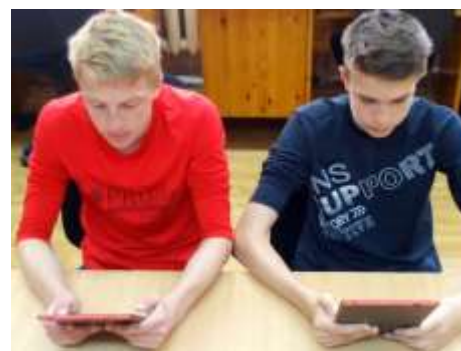
Урок с использованием МЭШ

МОУ «Гимназия №2» выбрана площадкой для создания и внедрения инновационной модели учреждения «Базовая школа - центр дистанционного обучения». Образовательный ресурс МЭШ представлен учебными онлайн-курсами. В учреждении была сформирована группа преподавателей, работающих по технологии «МЭШ», проведен цикл вебинаров для педагогов по теме «Возможности проекта МЭО», на базе учреждения проведены открытые уроки с применением современных средств обучения. Оборудован мобильный класс.