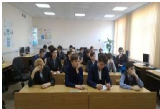
Вебинар «Технология работы по реализации проектов (практический опыт)»