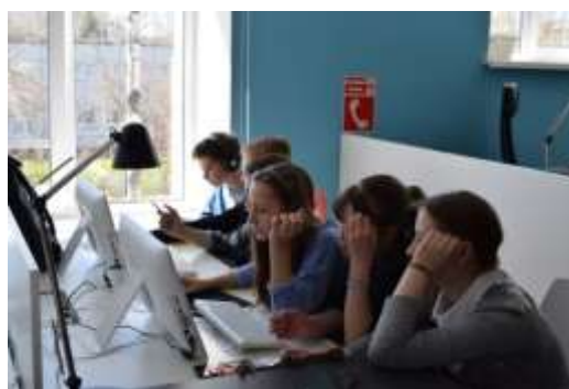
Сотрудничество с социокультурным центром Теффи. Чтение электронных книг.