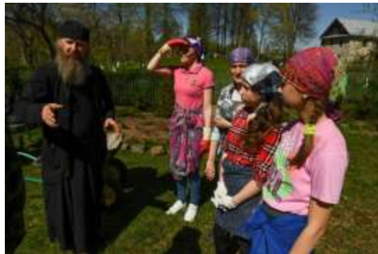
Гражданская активность – помощь монастырю