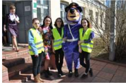
Волонтеры на празднике ПДД