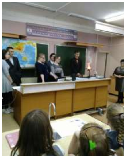
Защита проектов обучающихся в МОУ «Лицей №8» и МОУ «Гимназия №2»