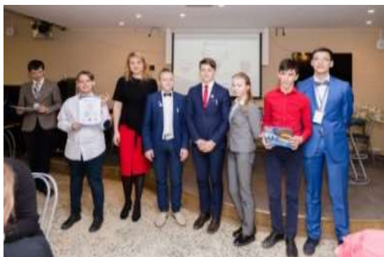
Финал Чемпионата по интеллектуальным играм «ПоЛЭТеЛИ с нами» среди школьников Ленинградской области