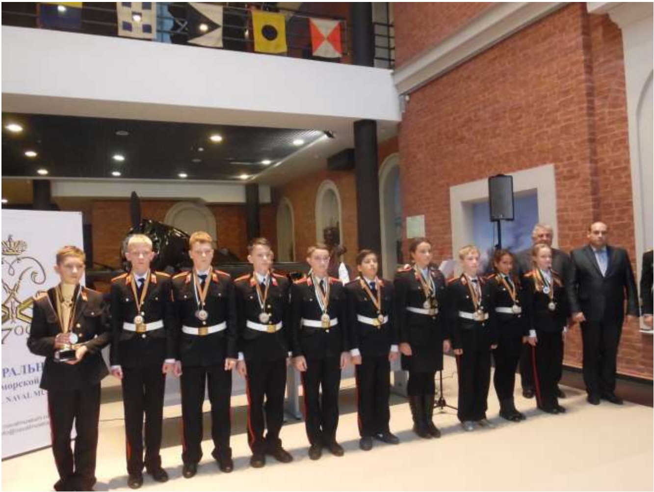
3 место в общем зачёте. Ура!!!