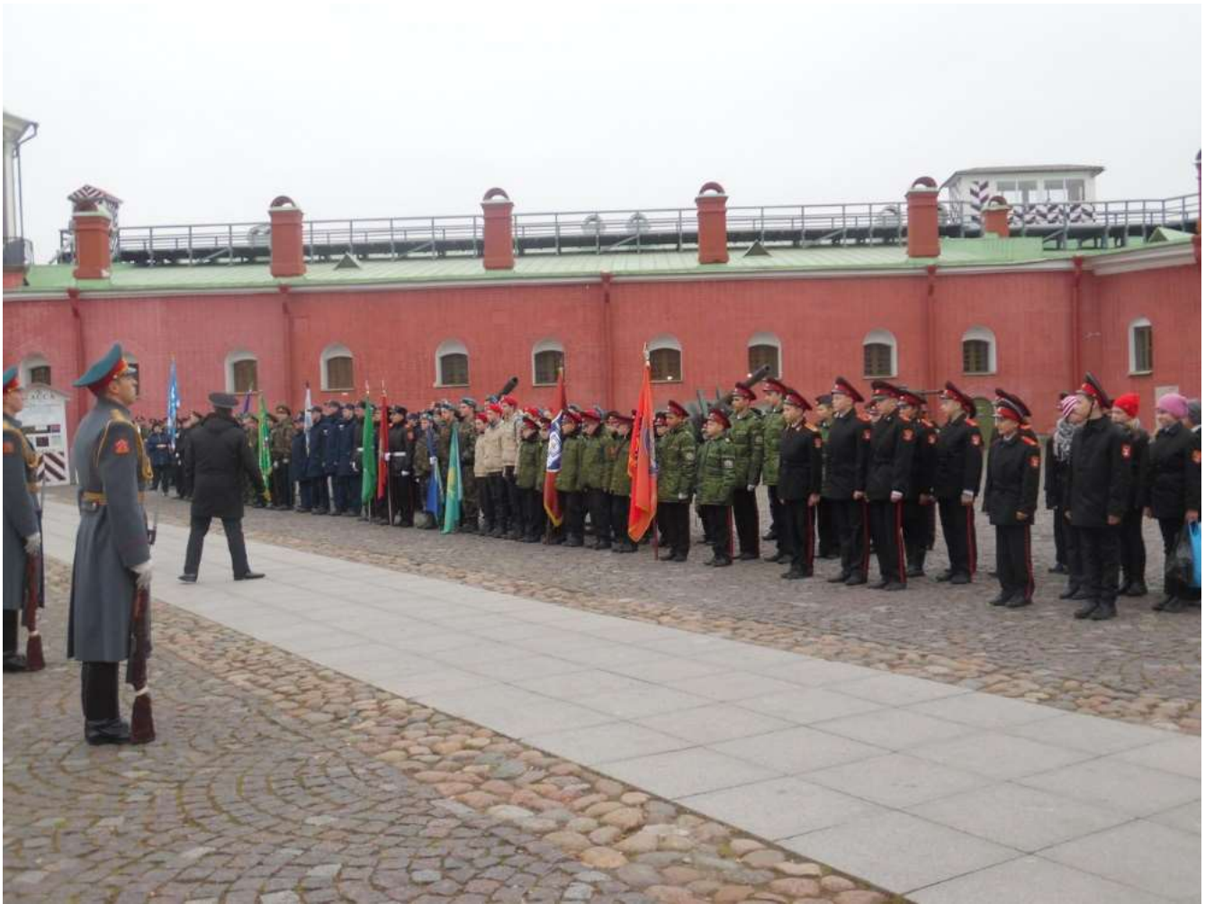
Смотр строя и песни в Петропавловской крепости.