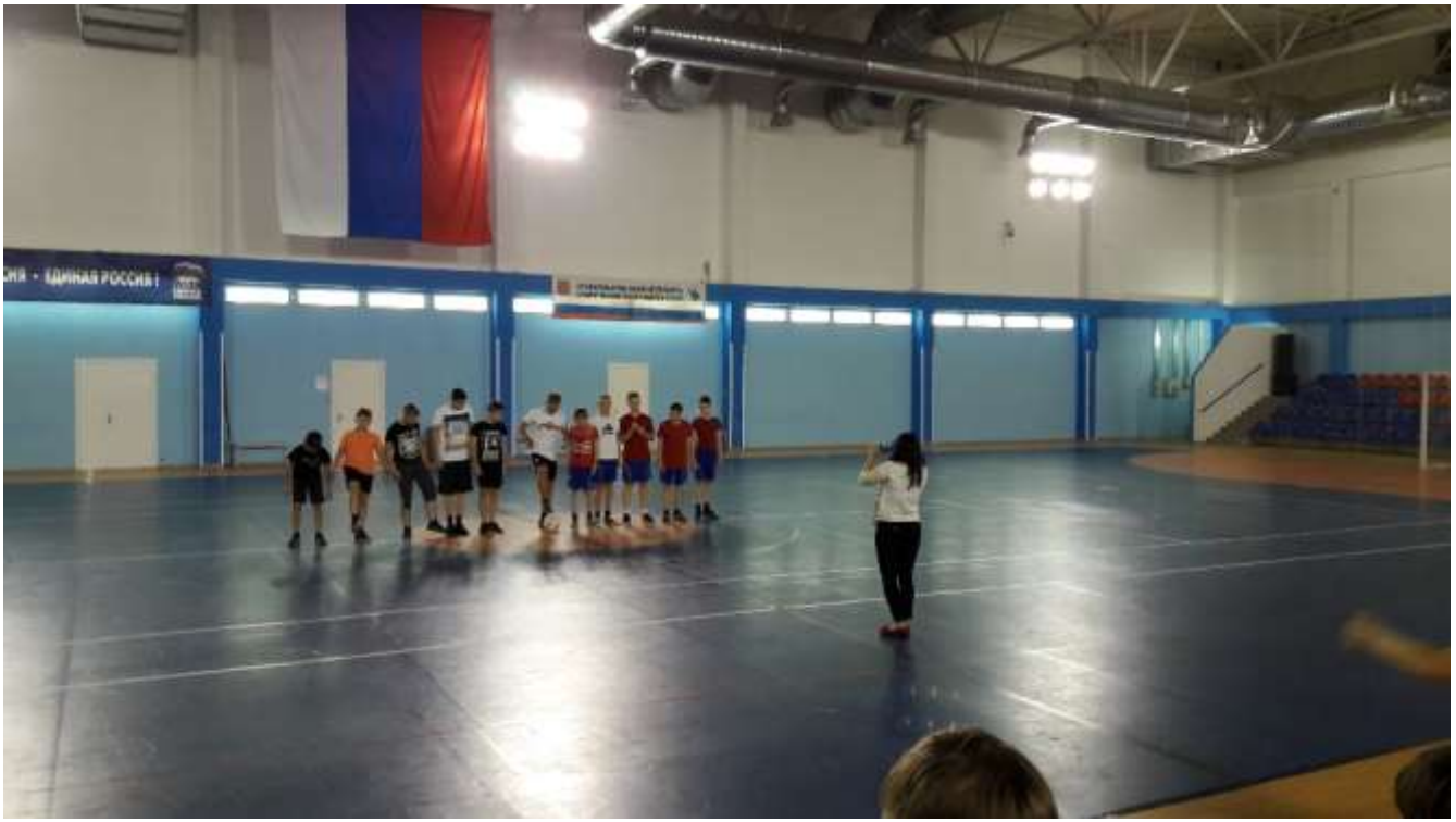
Соревнования по мини – футболу.