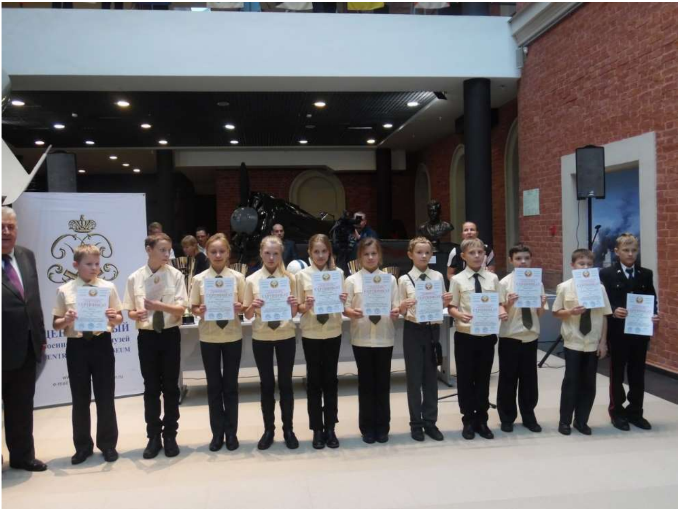
Команда 5 кадетского класса