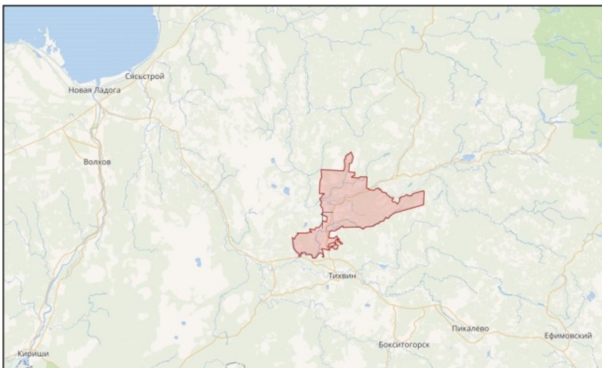
Рисунок 2 – Расположение административного центра – п. Бор