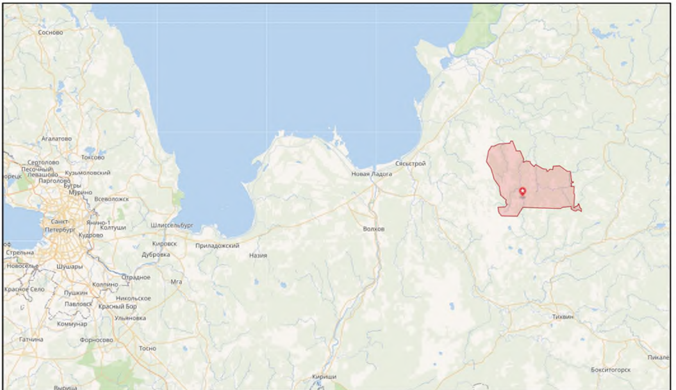
Рисунок 2 – Расположение административного центра – д. Коськово