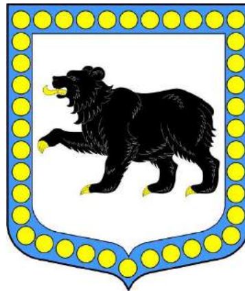
Схема теплоснабжения Муниципального образования Мелегежское сельское поселение Тихвинского муниципального района Ленинградской области на период до 2032 года

решением совета депутатов Мелегежского сельского поселения от «02» ноября 2023 г. № 07-172 (приложение)